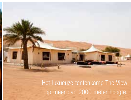
Het luxe tentenkamp The View op meer dan 2000 meter hoogte.