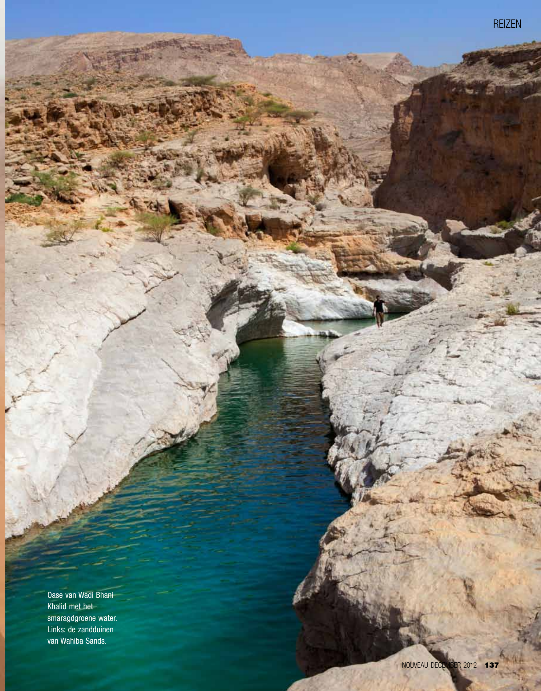
Oase van Wadi Bhani Khalid met het smaragdgroene water. Links: de zandduinen van Wahiba Sands.

TEKST: HARMKE KRAAK