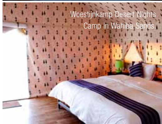
Woestijnkamp Desert Nights Camp in Wahiba Sands.