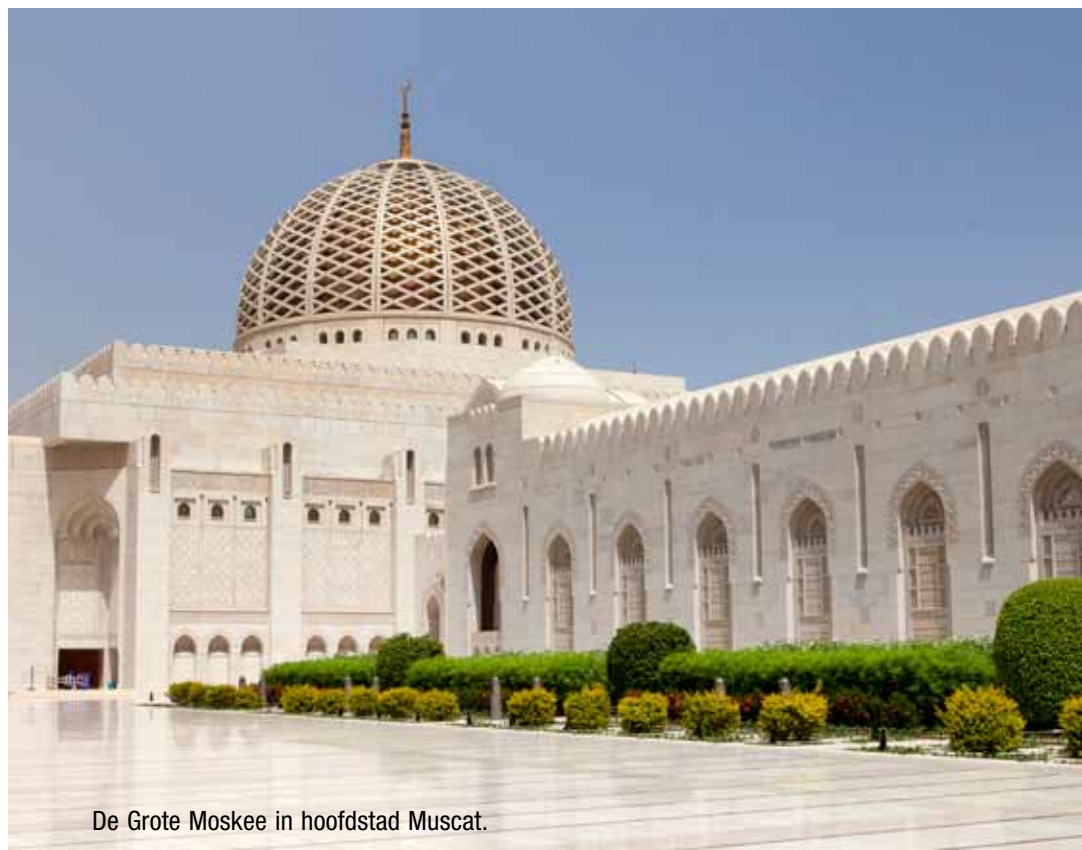
De Grote Moskee in hoofdstad Muscat.