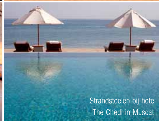
Strandstoelen bij hotel The Chedi in Muscat.