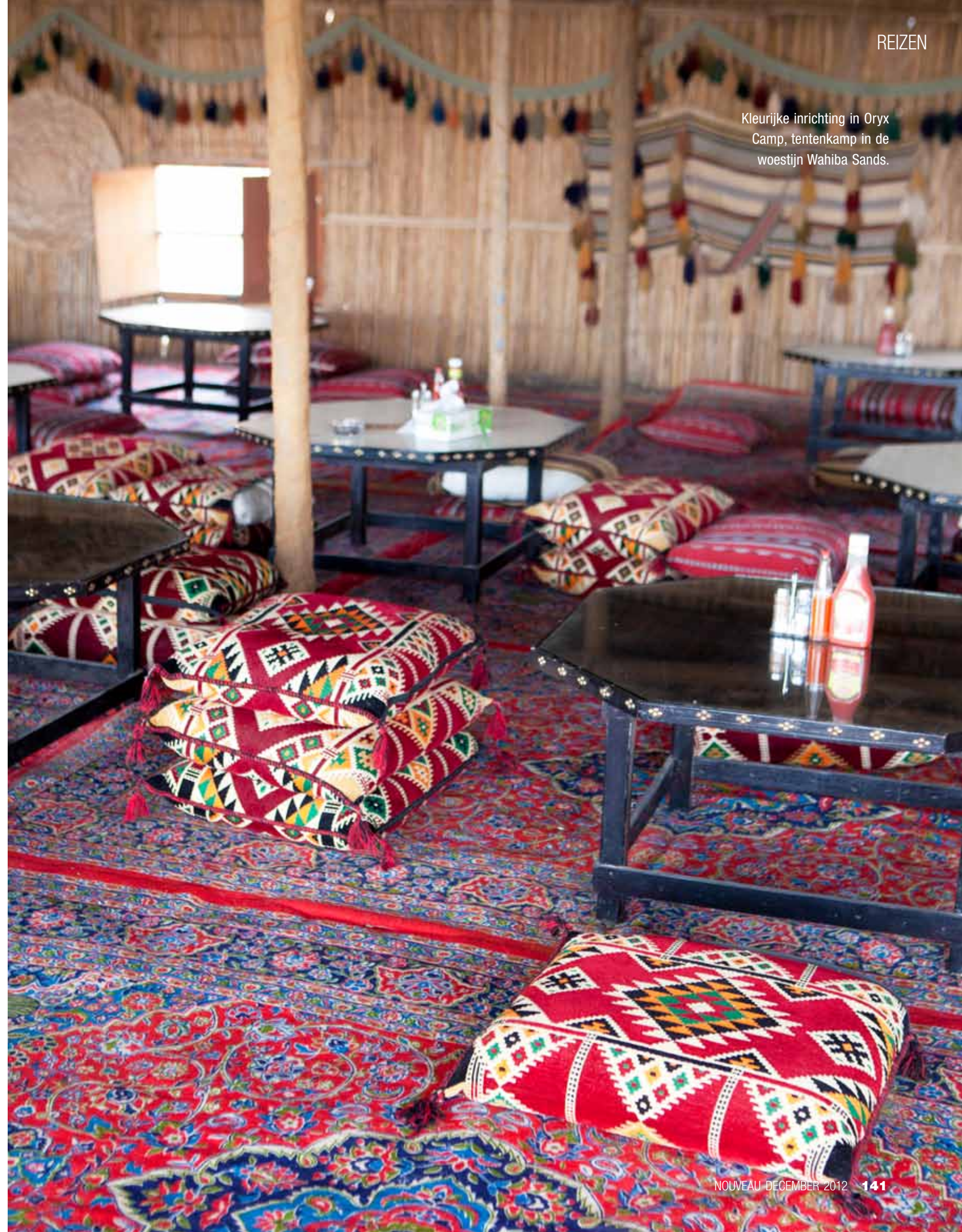
Kleurrijke inrichting in Oryx Camp, tentenkamp in de woestijn Wahiba Sands.

We zetten koers naar de kust, naar Sur. Het ligt aan een turkoois-kleurige baai en de huizen zijn er helderwit. Vanaf Sur volgen we de kustroute naar Ras Al-Jinz, waar een schildpaddenreservaat is. Zodra de duisternis inzet, gaan we met een gids het strand op. Het hele jaar door komen hier zeeschildpadden aan land om eieren te leggen. Met de naderende supermaan is de kans kleiner dat we ze te zien krijgen, maar we hebben geluk. Er is een groene zeeschildpad gesignaleerd! We observeren het dier van achteren, buiten zijn blikveld. De schildpad van wel een meter doorsnee hangt rustig boven een diepe kuil waarin ze tientallen eieren werpt. Dan begint ze de kuil te dichten. Met haar voorpoten maait ze scheppen zand naar achteren om de eieren toe te dekken. Dit is wel heel bijzonder! Ik sta zó dichtbij, dat ik een volle lading zand in mijn gezicht krijg. Bij het ochtendgloren gaan we opnieuw het strand op. Ditmaal zien we brede sporen in het zand. Het lijken bandensporen, maar ze zijn afkomstig van de schildpadden. Er zijn ook smalle sporen bij van babyschildpadden. Ze zijn uit hun ei gekropen en hebben op eigen kracht de weg naar zee moeten vinden. De lege eierschalen liggen als stille getuigen in het zand. We keren vandaag terug naar Muscat en eindigen onze reis waar we zijn begonnen, bij The Chedi. We eten buiten. De palmbomen zijn verlicht, de vuurschalen flakkeren en aan de hemel staat een kogelronde maan. Het is zover, het is supermaan. →