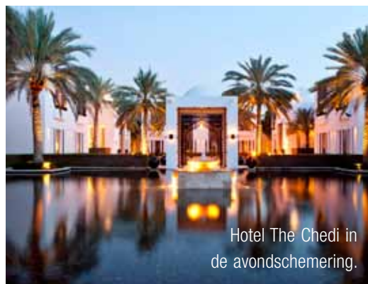
Hotel The Chedi in de avondschemering.