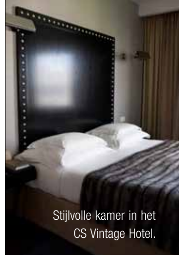
Stijlvolle kamer in het CS Vintage Hotel.

Er zijn veel mooie winkels en etalages in Lissabon. Bij Poison d'Amour zijn de taartjes net kunstwerkjes. De felroze frambozenmacarons zijn heerlijk. Ook 's avonds is het een en al leven in Barrio Alto. Overal stijgen geuren op van geroosterde vis. We kiezen een tafeltje op straat bij restaurant Um Mundo de Sabores. De kleine straat is versierd met slingers en lampions. Een vrouw in een werkschort zingt luidkeels en met rauwe stem. Heel anders dan de zoetgevooides Cristina Branco, maar misschien is dit wel wat de Portugezen zelf onder échte fado verstaan.