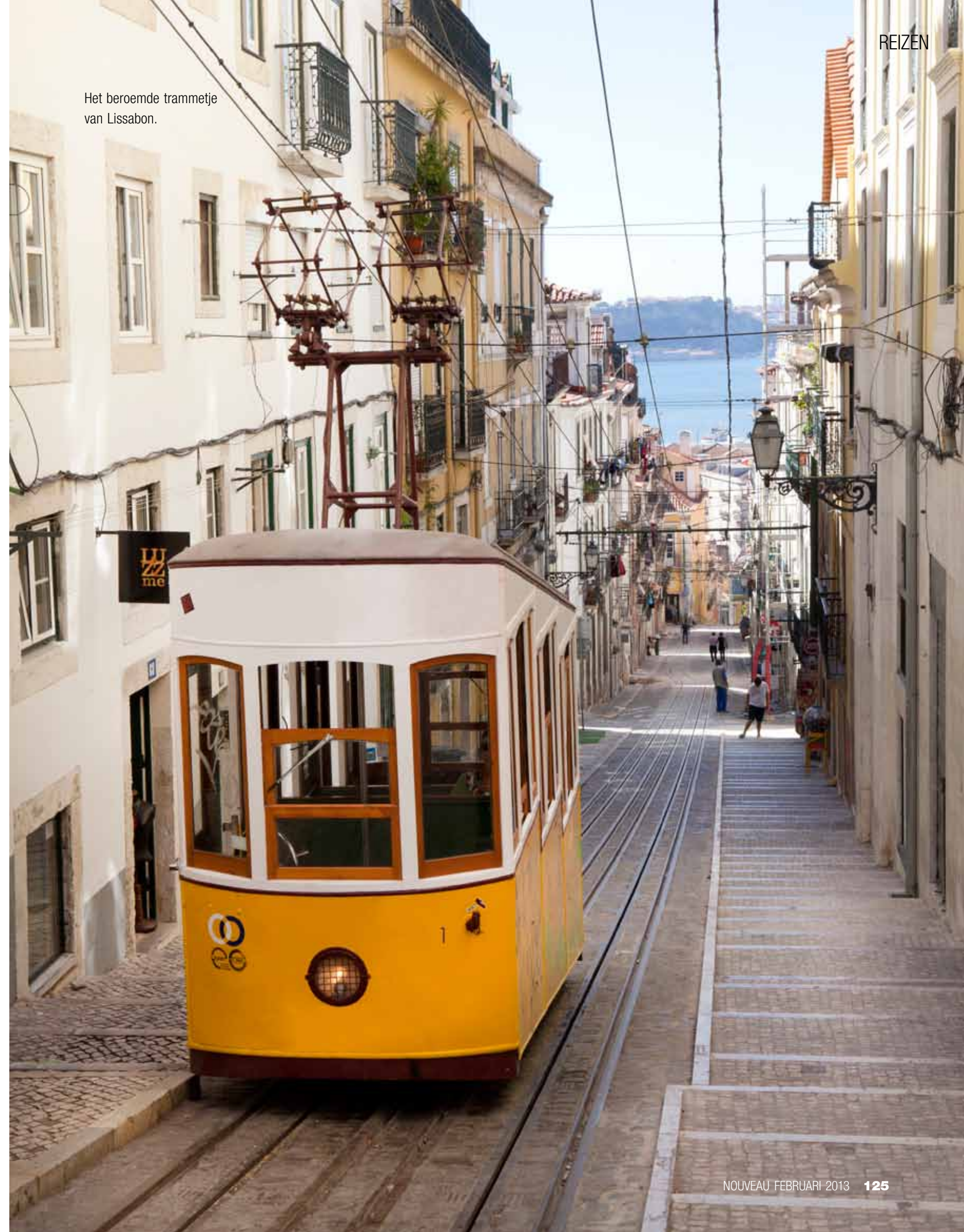
Het beroemde trammetje van Lissabon.

Lissabon, bruisende stad aan de Taag, bakermat van de fado. Zangeres Cristina Branco geeft haar favoriete adressen in de metropool prijs en verzorgt een exclusief concert voor Nouveau-lezeressen.