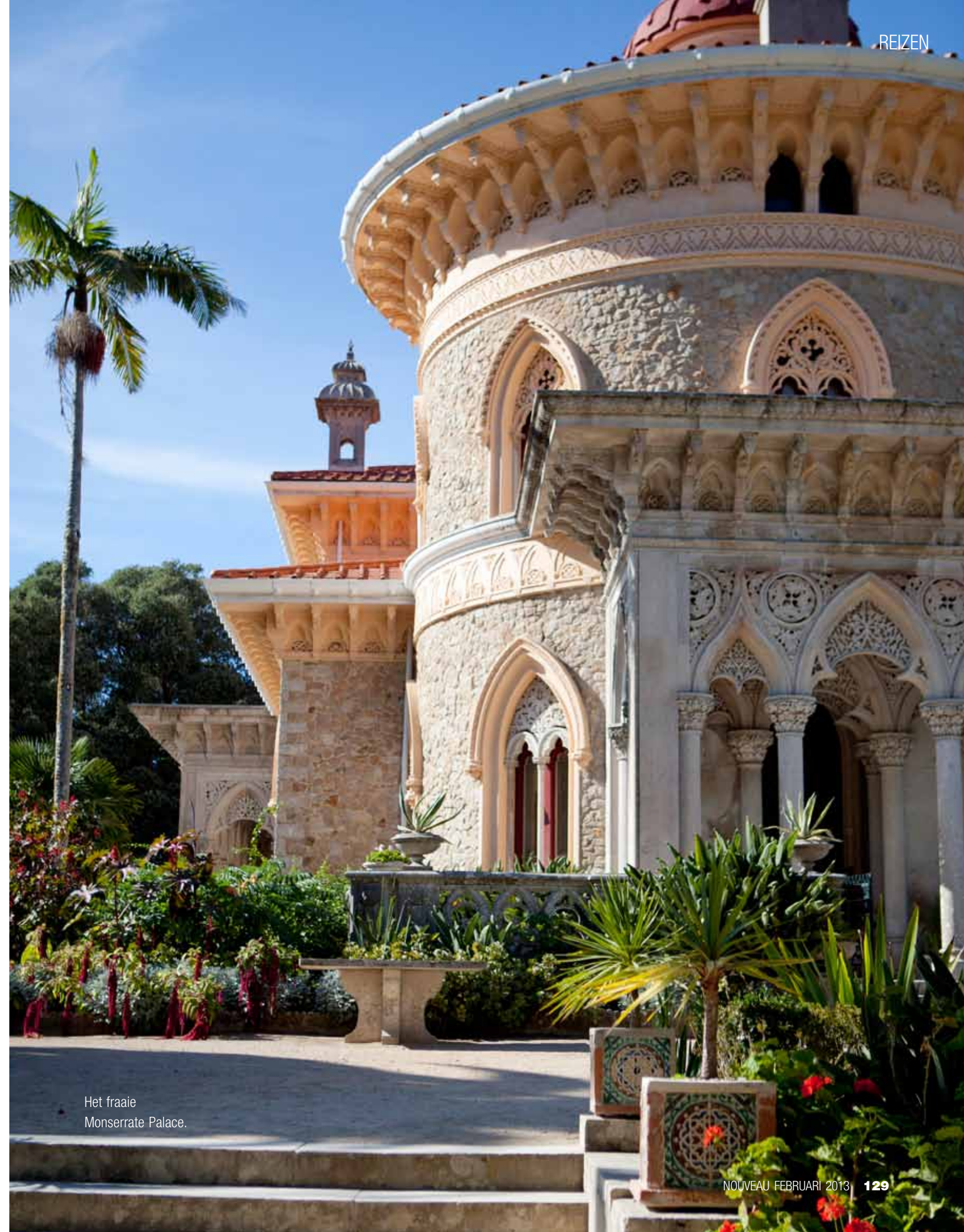
Het fraaie Monserrate Palace.