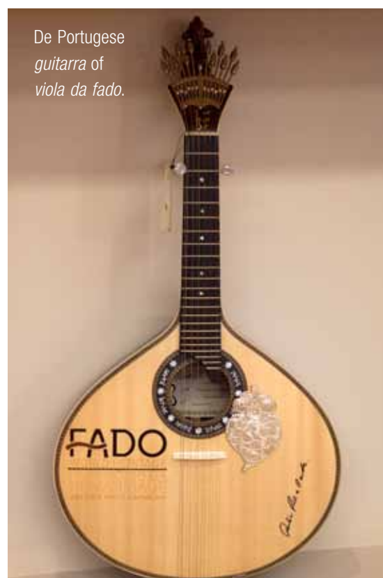
De Portugese guitarra of viola da fado.