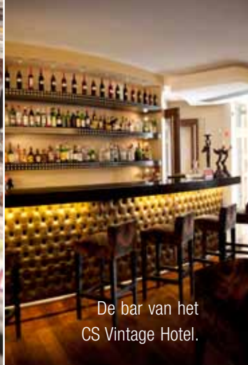
De bar van het CS Vintage Hotel.