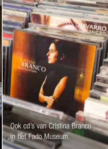
Ook cd's van Cristina Branco in het Fado Museum.