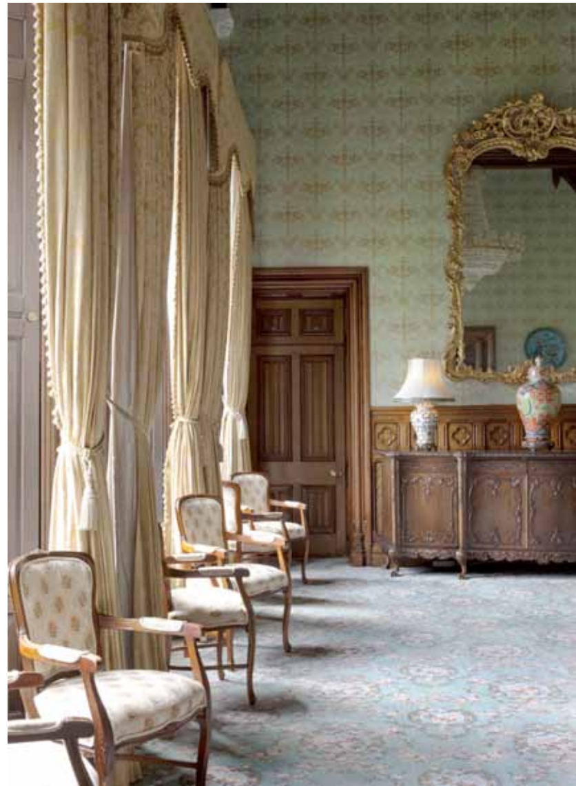
In Ashford Castle waan je werkelijk kasteelheer of -dame voor een dag. De imposante ruimtes, het vele houtwerk, de luxe tapijten en elegante meubels passen perfect in het plaatje.