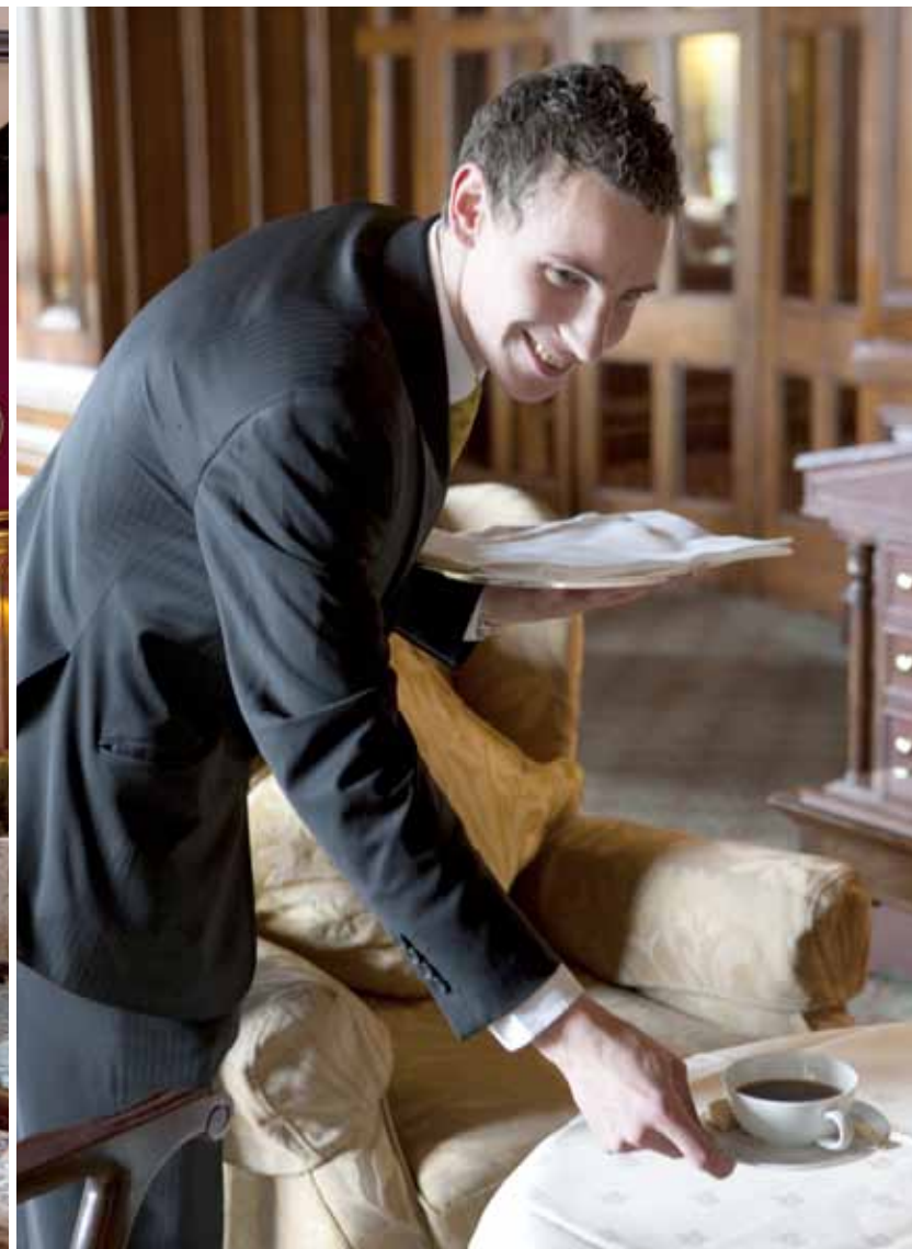
Foto links: de handgeweven tapijten in de Oak Hall zijn van het label Couristan. Foto rechterpagina: de fauteuils en banken in de Drawing Room zijn bekleed met stoffen van Colefax and Fowler.