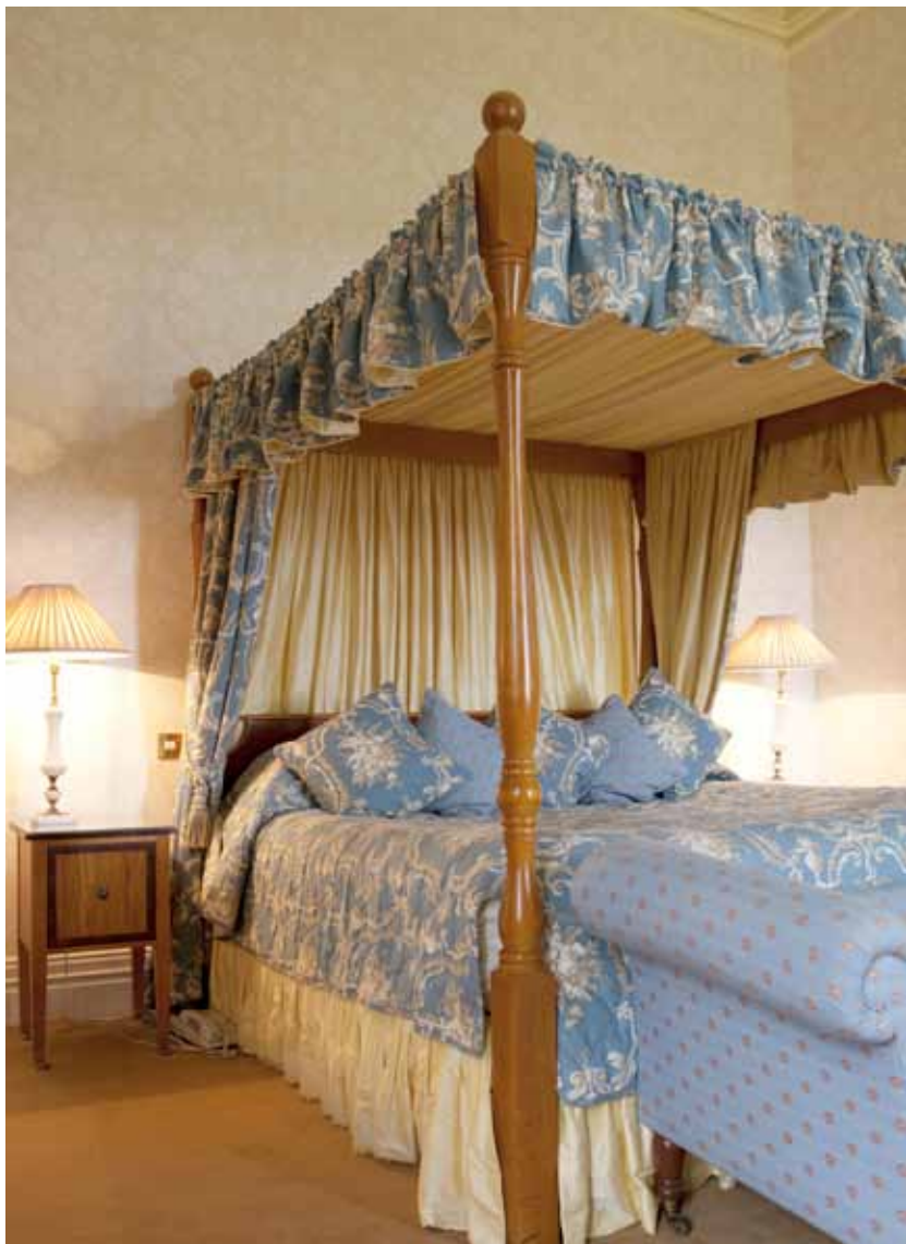
Foto links: ook de slaapkamers bieden een weelderige indruk. Prachtige houten bedden met een romantisch baldakijn garanderen de gasten een heerlijke nachtrust in het kasteel.