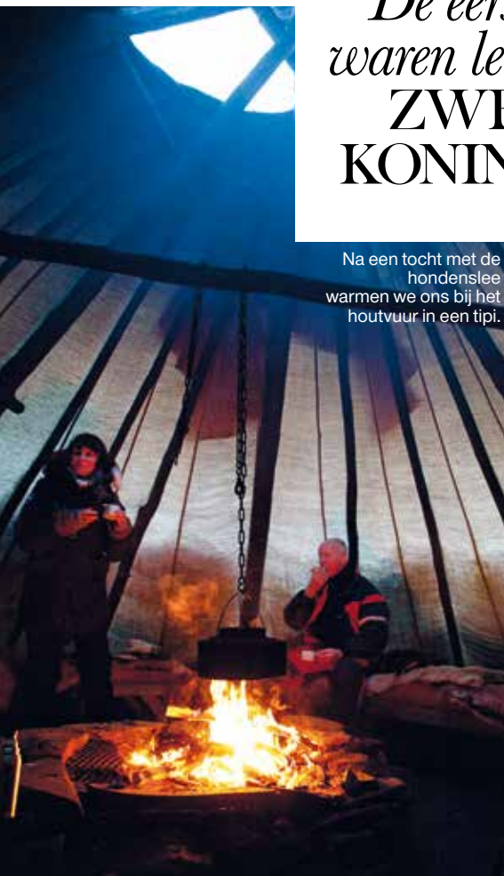
Na een tocht met de hondenslee warmen we ons bij het houtvuur in een tipi.