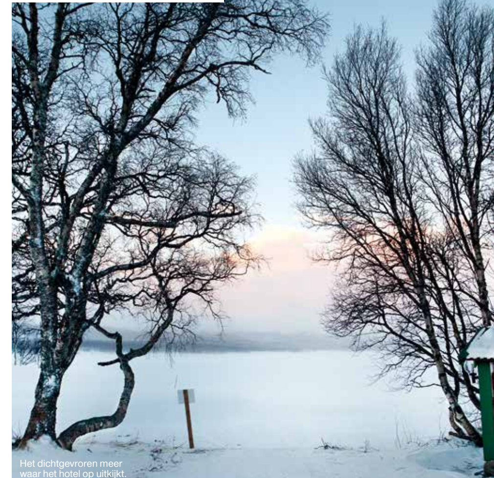
Het dichtgevroren meer waar het hotel op uitkijkt.

We eten MALS RENDIERVLEES en zalm met hazelnoten