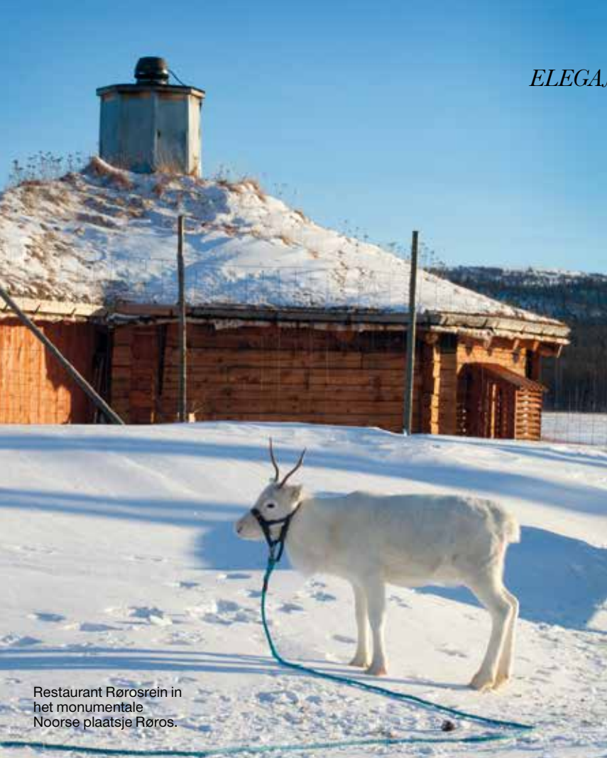
Restaurant Rørosrein in het monumentale Noorse plaatsje Røros.

uiterst vers, want hoewel we in de bergen zijn, is de oceaan niet ver. Zoals we tijdens de lunch al hebben geproefd is de keuken van topniveau. Zowel chef Patrik als sous-chef Magnus Burstedt hebben de nodige ervaring opgedaan bij sterrenrestaurants, waaronder Dahlgren in Stockholm.