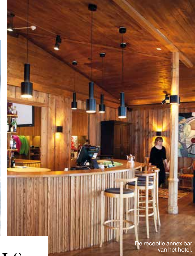
De receptie annex bar van het hotel.

We eten MALS RENDIERVLEES en zalm met hazelnoten