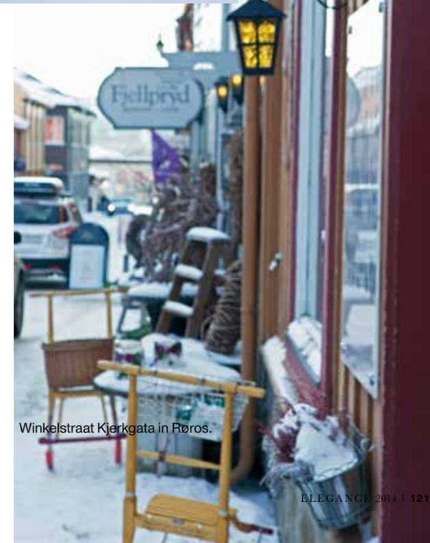
Winkelstraat Kjerkgata in Røros.